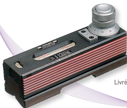
Livré en coffret

Base prismatique en acier trempé et rectifié pour mesurer l'inclinaison des surfaces ou des cylindres.