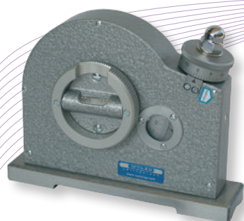
Livré en coffret

Niveaux à bulle et vis micrométrique pour la mesure précise de toute inclinaison. Base prismatique en acier trempé et rectifié pour mesurer l'inclinaison des surfaces ou des cylindres.