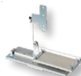
Table à mouvement horizontal pour contrôle de la force nécessaire à décoller les bandes adhésives, films protecteurs, film cuivre (circuit imprimé) dans le sens vertical à 90°